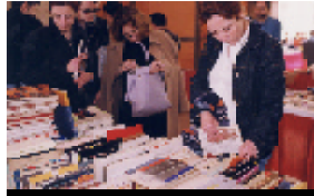
Encants a Can Massallera