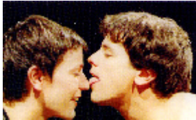
Tu vida en 65 minutos