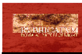
L'empremta de Roma

Des del passat dia 30 es pot veure una exposició que inicia les activitats per celebrar els 50 anys del descobriment de les Termes Romanes. La mostra, dividida en deu àmbits temàtics, porta per títol Rubricatum. Roma al Baix Llobregat . Es tracta d'un repàs al voltant de la influència dels antics romans al Baix Llobregat, passant per la vida quotidiana, la cultura del vi o la mineria, entre altres aspectes. Es podrà veure fins al 26 d'octubre a Can Torrents i, posteriorment, es desplaçarà a diversos museus de la comarca.