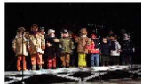
De tot per als infants