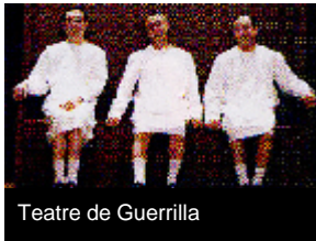
Teatre de Guerrilla