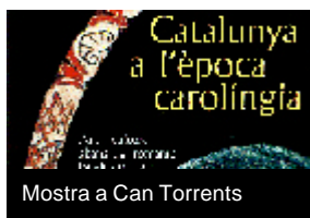
Mostra a Can Torrents

Fins al 23 de març continua oberta al públic al Museu de Sant Boi (Can Torrents) la mostra Catalunya a l'època carolíngia. Art i cultura abans del romànic (segles IX i X) . L'exposició aplega part del material que es va poder veure al Museu Nacional d'Art de Catalunya a final de 1999, i està integrada en un projecte europeu sobre Carlemany. Es tracta d'una panoràmica sobre un moment clau en la formació de Catalunya, ja que és en aquell període quan queda identificada com un territori amb característiques pròpies dins de l'antiga Hispània i l'Europa Occidental. D'altra banda, encara teniu temps de visitar l'exposició sobre les religions a l'antiga Roma: Sacra Romae . La podeu veure a les termes romanes fins al 30 de març. La mostra ens presenta l'evolució cronològica de les religions i ritus més importants que es van practicar als territoris romans a l'època de l'Imperi Romà.