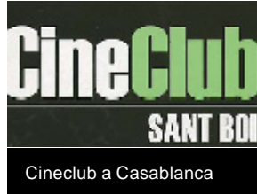
Cineclub a Casablanca