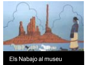
Els Nabajo al museu

Un taller ens mostra la cultura dels indis americans