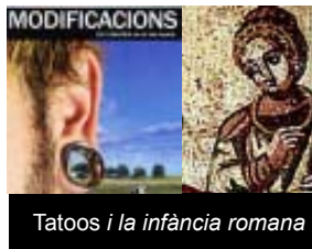
Tatoos i la infància romana

Continuen les mostres sobre tatuatges i pircings i sobre els infants a la Roma clàssica