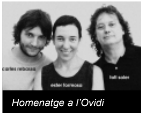
Homenatge a l'Ovidi