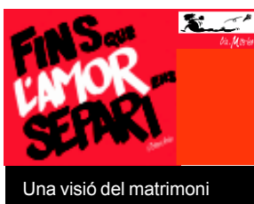
Una visió del matrimoni

La Temporada de Teatre continua oferint-nos propostes interessants i de qualitat. Es tracta d'espectacles molt diferents els uns dels altres, però sempre amb un mateix objectiu: enriquir-nos culturalment i emocionalment. Fins ara hem pogut veure Entre caixes , amb la companyia Llum de Ganxo, i Sa història des senyor Sömmer , a càrrec de Pep Tosar i Xicu Massó. El proper dia 11, a les 22 h, Can Massallera, presenta Ovidi Montllor: deu catalans i un rus , un espectacle a mig camí entre concert musical i la poesia, amb Toti Soler, Ester Formosa i Carles Rebasça. La proposta commemora els deu anys de la mort d'Ovidi Montllor. El nom de l'espectacle és el que el mateix Ovidi i Toti Soler donaven als onze muntatges poètics que van fer durant més de vint anys. Ara com ara, el segon ha volgut recuperar-los per recordar la trajectòria del cantautor valencià. Amb l'Ester Formosa, cantant les cançons, i el Carles Rebasça recitant poemes, l'espectacle és ple de sensibilitat i tendresa. Així mateix, us avancem que el proper 3 d'abril, a les 19 h, l'espectacle previst dins de la programació de la Temporada de teatre és la comèdia Fins que l'amor ens separi , una particular reflexió sobre el matrimoni, de la companyia Mitel-les. L'obra es defineix com a «comèdia de núvies» i tracta sobre les alegries, les obsessions i les tristeses de les dones que estan a punt de «dir el sí» o, potser no.