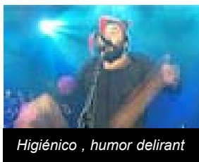
Higiénico, humor delirant