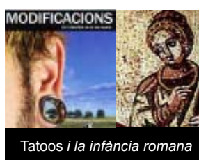
Tatoos i la infància romana

El Museu de Sant Boi continua presentant dues exposicions força interessants: Modificacions. Art i identitat en el cos humà i Pueritia. La infància romana . La primera, que es pot veure a Can Torrents fins al 3 d'abril, oferirà el proper dia 20 una visita nocturna especial adreçada als joves. Aquestes visites són una iniciativa que forma part d'un nou plantejament del Museu per apropar-se a un públic més jove. Pel que fa a la mostra sobre la vida dels nens i les nenes a l'antiga Roma estarà a disposició del públic fins al 14 de maig a les Termes Romanes. Aquesta exposició explica la vida i les inquietuds dels infants que van viure a l'època de la Roma clàssica.