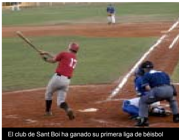
El club de Sant Boi ha ganado su primera liga de béisbol