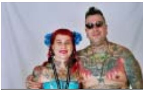
Tatoos i pírcing al Museu