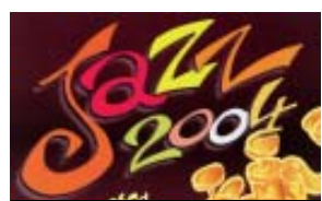
Tardor de jazz