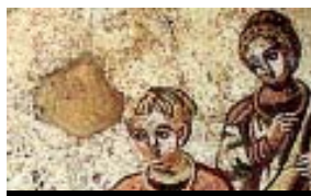
La infància a Roma