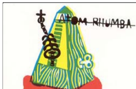
Funky-blues de qualitat