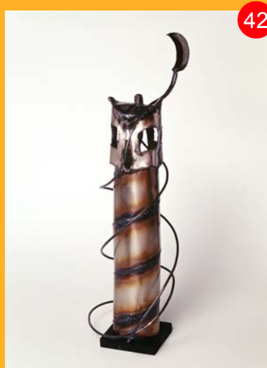
El fondo municipal cuenta con tres obras de Eduardo Chillida, una de las grandes figuras del arte contemporáneo