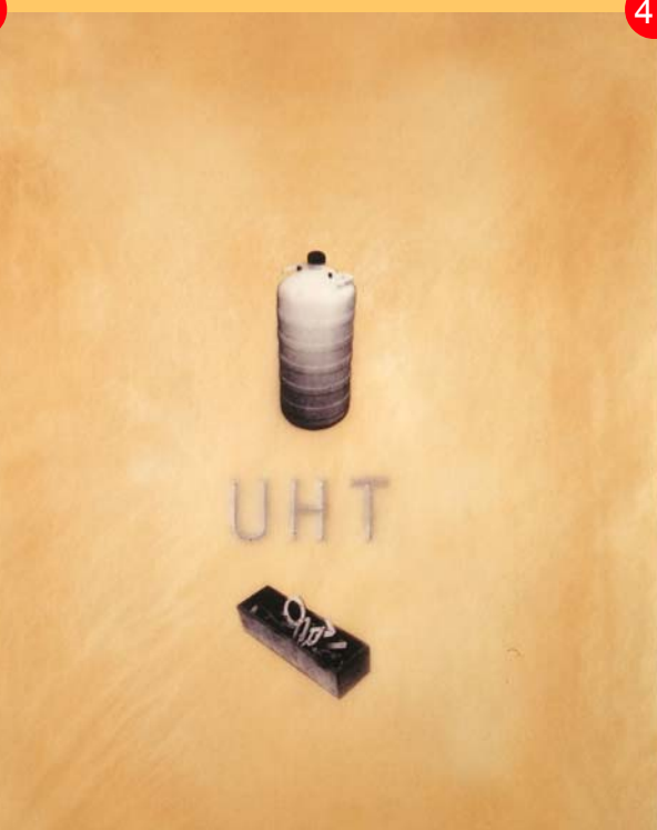
Jaume Plensa, de la sèrie Suite voleurs