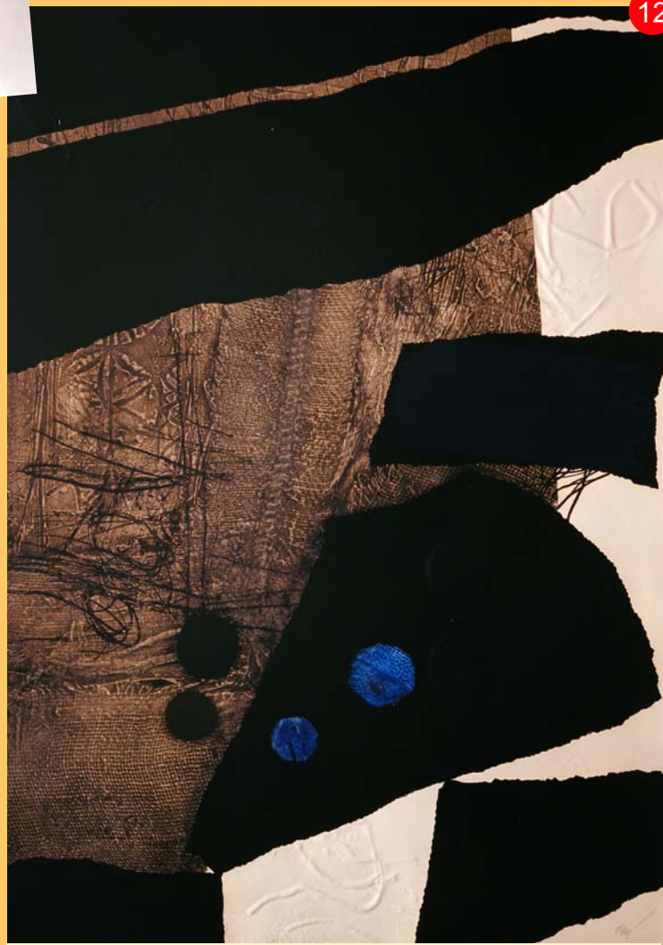
Gravat d'Antoni Clavé