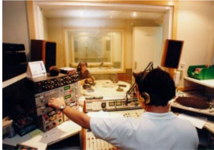
L'emissió de Ràdio Sant Boi (89.4 FM) combina els programes d'entreteniment amb una curosa atenció a l'actualitat